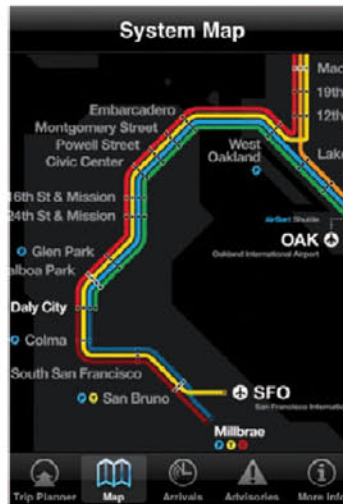
Un nouvel iPhone a été repéré sur le réseau de San Francisco par iBart de Pandav, une application de transport en commun en temps réel.

Comme toujours avec Apple, tout commence par une rumeur. Pandav, une entreprise spécialisée dans le développement d'application affirme avoir détecté un nouvel iPhone du côté de San Francisco, non loin du siège d'Apple. Ils ont vu apparaître un « iPhone 3.1 » sur leur informatique, ainsi qu'une ligne d'identification inconnue pour aucun autre iPhone, alors que le 3G S portait le nom de 2.1 et celui du 3G, 1.2. Il n'en faut pas moins pour en déduire que des testeurs se promènent dans les rues de San Francisco pour essayer le nouveau téléphone. Une rumeur qui semble probable puisqu'Apple nous a habitués à sortir ses téléphones au mois de juin et que les précédents iPhone sont apparus huit mois avant leur commercialisation. Reste à savoir à quoi ressemblera ce nouveau modèle. D'autres rumeurs, moins précises, celles-là, prédisent qu'il aura plusieurs processeurs, histoire de rendre l'iPhone plus rapide et d'améliorer la durée de la batterie. D'autres pensent qu'il sera compatible avec la 4G, un réseau plus rapide que la 3G, que l'opérateur américain Verizon compte lancer en 2010. Réponse probable en juin 2010.